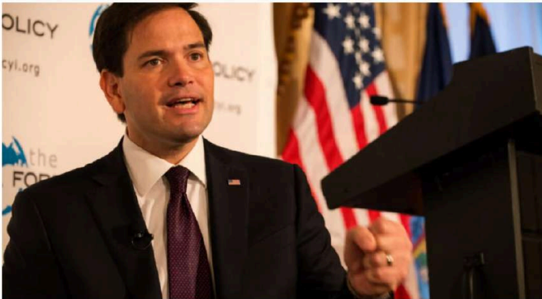
El entonces candidato a senador republicano Marco Rubio, en un acto en Nueva York el 14 de agosto de 2015

Primera modificación: 03/10/2023 - 11:21 1 min