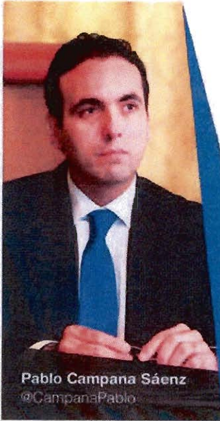
Pablo Campana Sáenz @CampanaPablo