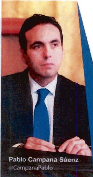
Pablo Campana Sáenz @CampanaPablo