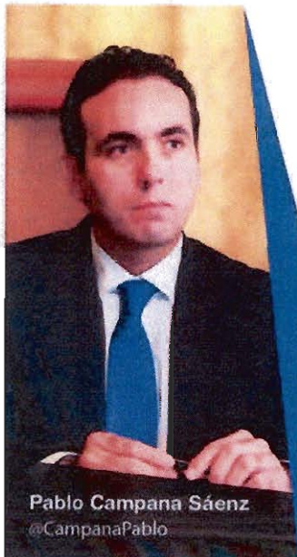
Pablo Campana Sáenz @CampanaPablo